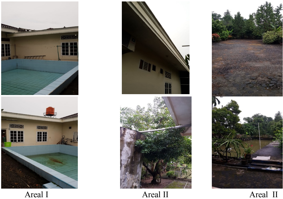
Gambar 1. Gambaran masing-masing areal tangkapan dan tempat penampungan air hujan untuk masing-masing area

Prediksi air hujan dari setiap areal penampungan air hujan dilakukan menggunakan aplikasi android “Runoff prediction) (Rahim, Supli dan Damiri, 2017). Screenshot dari aplikasi runoff prediction itu disajikan pada Gambar 2.