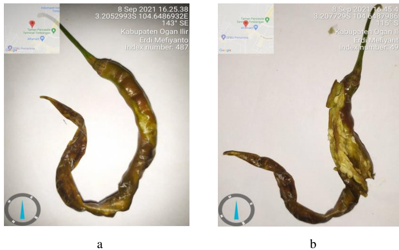
a b Gambar 2. Cabai muda yang terserang lalat buah