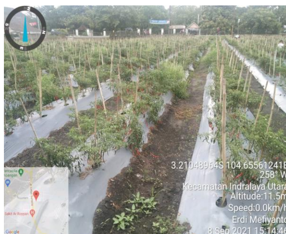
Gambar 1. Cabai pada lahan yang diamati