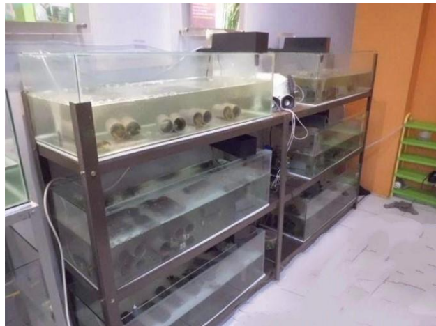
Gambar 1. Budidaya lobster air tawar ( Cherax quadricarinatus ) secara konvensional dalam akuarium dengan padat tebar 10 ekor/m yang didalamnya terdapat pipa paralon sebagai tempat persembunyian lobster (shalter) (Infoikan, 2018)

Adapun hasil desain yang didapat dari budidaya lobster air tawar dengan akuarium (Gambar 1) dan sistem apartemen (Gambar 2):